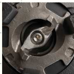
foto drtiče FURIATKA